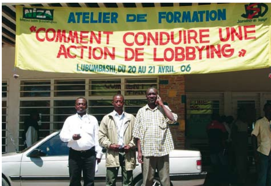
Deelnemers van de workshop