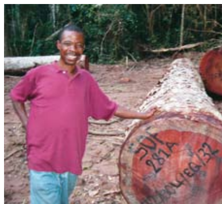
Houtkap in de DRC

Het Evenaarswoud in de Democratische Republiek Congo wordt op grote schaal illegaal gekapt. Milieuorganisatie OCEAN