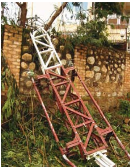
De omgewaaide antenne van Radio Maendeleo