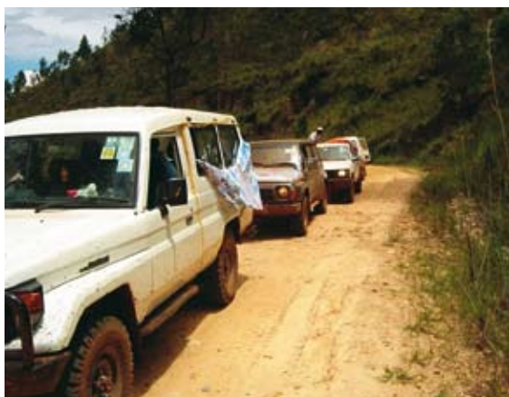
De jeeps van De Karavaan

De discussies trokken soms wel honderd bezoekers. Meegereisde radiojournalisten deden verslag van deze 'verkiezingsdebatten'. Maar ook van wat er ter plekke speelde onder de bevolking. Zoals het probleem van