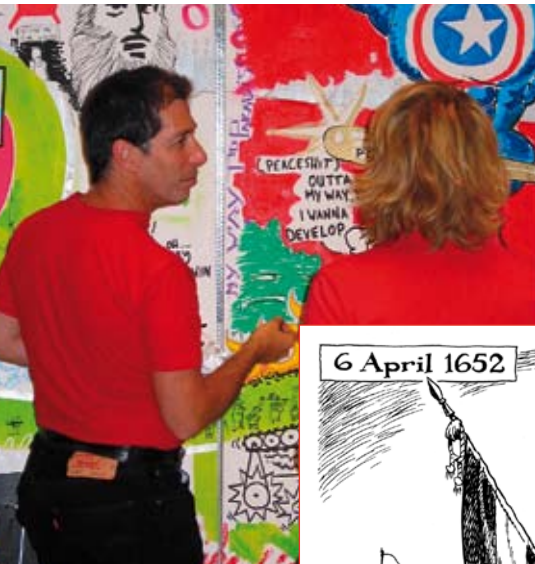
Jonathan Shapiro aan het werk tijdens de workshop op 8 december 2005

De Zuid-Afrikaanse cartoonist Zapiro is in december uitgeroepen tot winnaar van de Prins Claus Prijs. Hij won deze prijs voor zijn rake spotprenten over politieke en