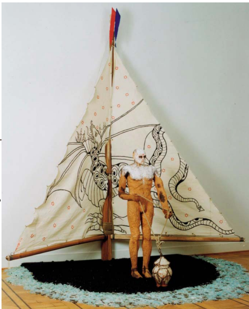
Santiago Rodríguez Olazábal, Yo desplegué las velas , 1997

“Kunst die uit de Afrikaanse diaspora voortkomt, is ontzettend belangrijk: het vermengt tradities van de Afrikaanse voorouders met nieuwe culturen”