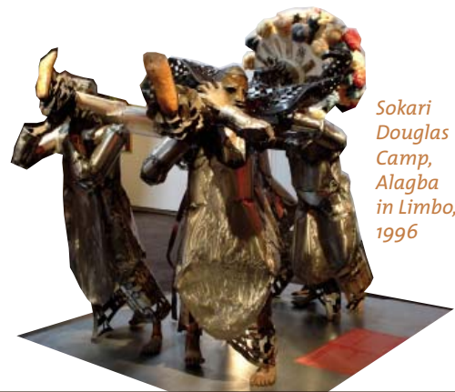
Sokari Douglas Camp, Alagba in Limbo, 1996