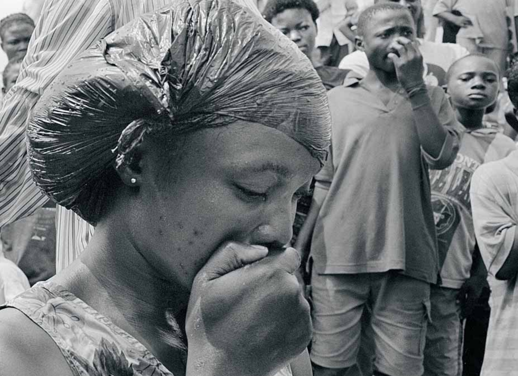
Doop van diamantgravers in Mbuji-Mayi, DR Congo.

stenenzoekers. Hun directe bazen zijn de licentiehouders die een deel van dat maanlandschap onder hun beheer hebben. In Sierra Leone kunnen dat zakenvrouwen zijn, maar in Angola zijn het vooral de oude generaals uit de burgeroorlog en in Congo onduidelijke 'gewapende groepen'. Er heerst een gewapende vrede: tussen de gravers onderling en tussen de gravers en hun bazen. De sterkste wint.