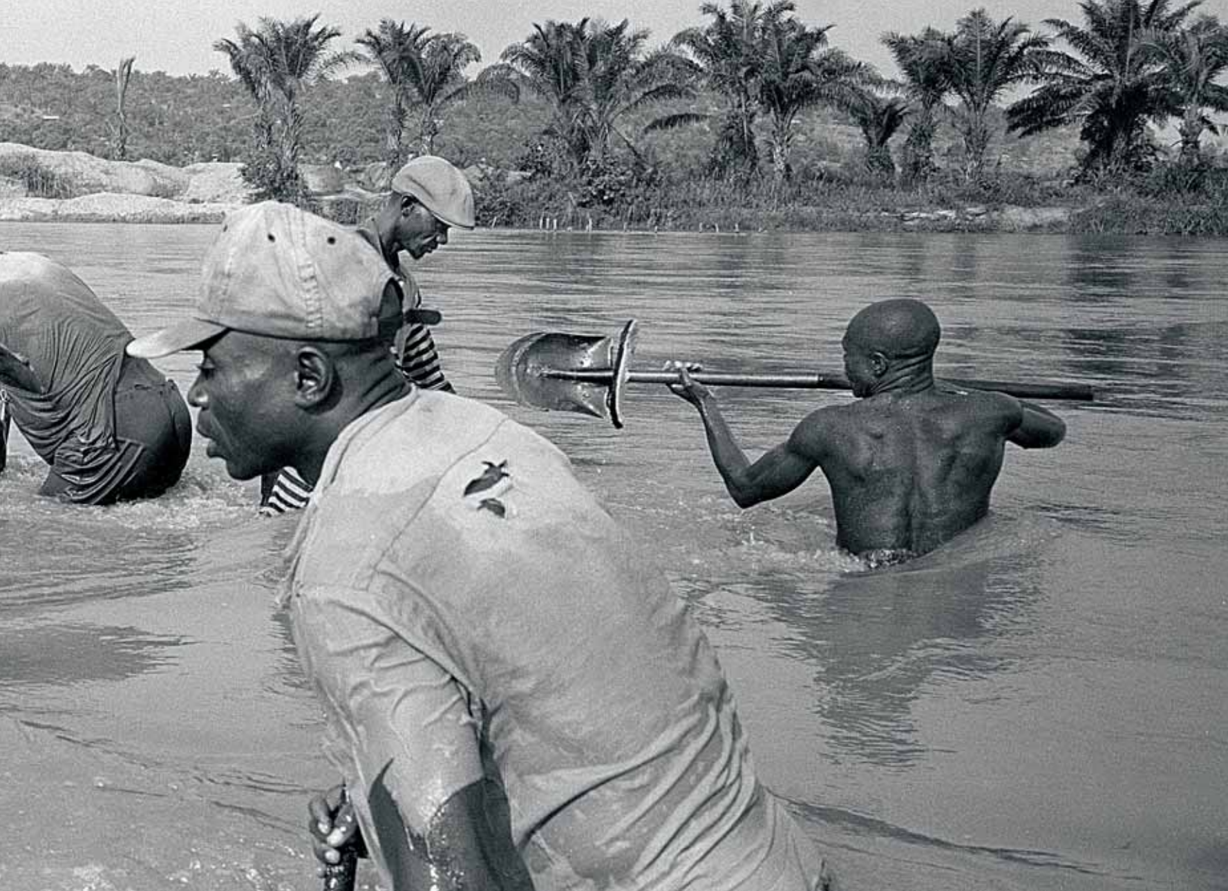
Winning in de rivier bij Mbj-Mayi, DR Congo.