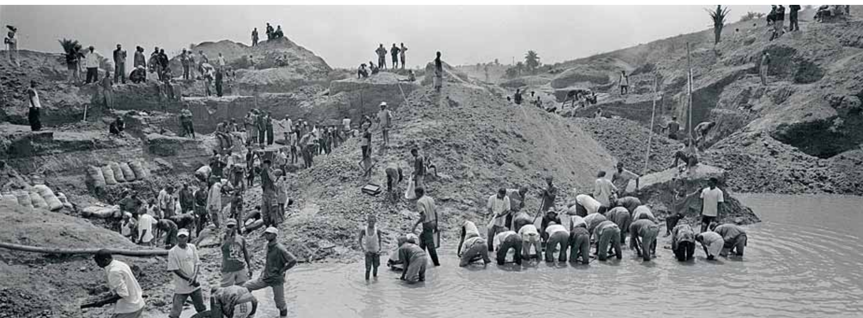
↓ Wassen van het zand in Bakwa Bowa, DR Congo.