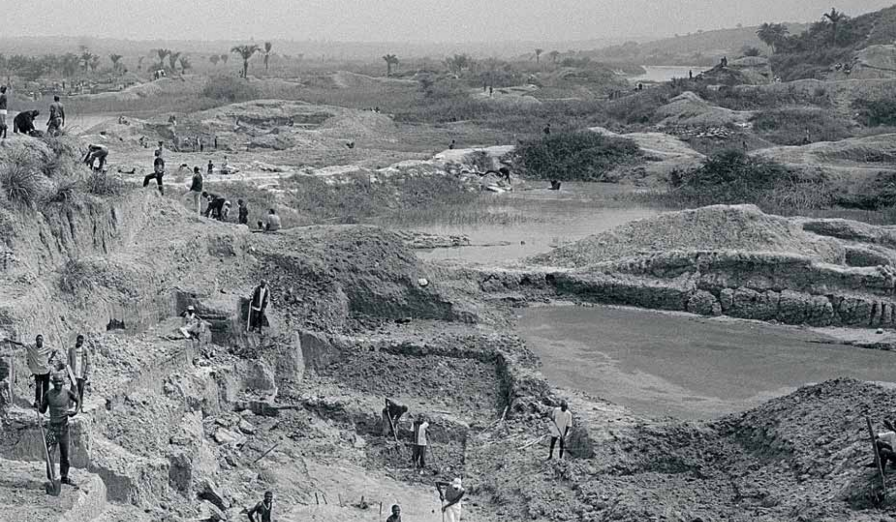
De mijnen in Bakwa Bowa, DR Congo.