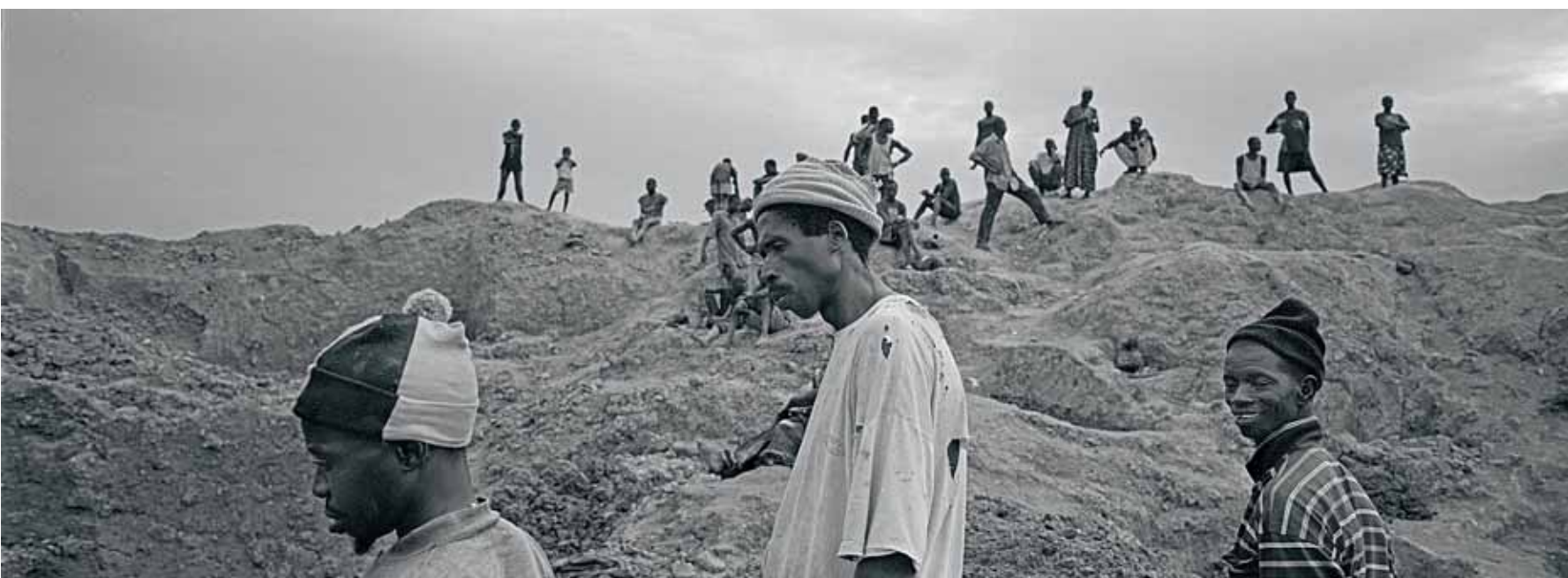
↓ Mijnen in Koidu, Sierra Leone.