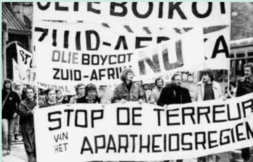
Anti-apartheidsdemonstratie in de jaren tachtig.