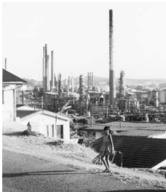
Olieraffinaderij pal naast het township Merebank bij Durban.

Grondstoffen zijn voor bijna heel zuidelijk Afrika de belangrijkste inkomstenbron maar houden tegelijkertijd de economische vooruitgang juist tegen. De strijd die bijvoorbeeld rondom diamanten is ontstaan in Angola en de DRC heeft een aanhoudende politieke