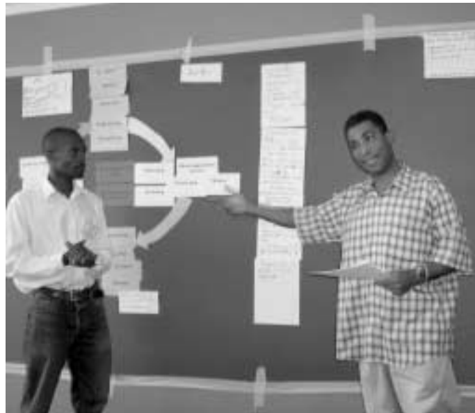
Workshop 'voorlichting geven aan ongeletterde volwassenen' (Malawi).

NiZA's financiële ondersteuning richt zich op de versterking van zowel individuele organisaties, als van een groep in zijn geheel. Zo volgen de partners als groep gezamenlijke trainingen of treden zij met of namens elkaar op tijdens onderhandelingen of campagnes. De achterliggende gedachte bij deze 'capaciteitsversterking als groep' is dat gezamenlijke acties meer invloed hebben op maatschappelijke veranderingen dan individuele.