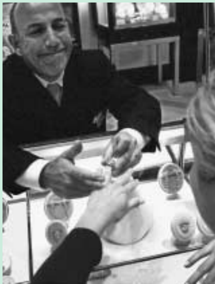
FOTO: KADIR VAN LOHUIZEN © (UIT FOTOTENTOONSTELLING 'DIAMOND MATTERS')

A frika is rijk. Pardon? Ja, rijk aan kostbare grondstoffen zoals olie, diamanten, koper en goud. Maar de gemiddelde Afrikaan merkt er niet veel van. Warlords vechten nog steeds om de grondstoffen. Maar ook buitenlandse bedrijven strijken een groot deel van de opbrengst op. Bovendien nemen ze het met de arbeidsomstandigheden en milieuregels niet zo nauw. Een aantal Afrikaanse regeringen legt hun daarbij weinig in de weg. Sterker nog, vele politici profiteren zelf mee.