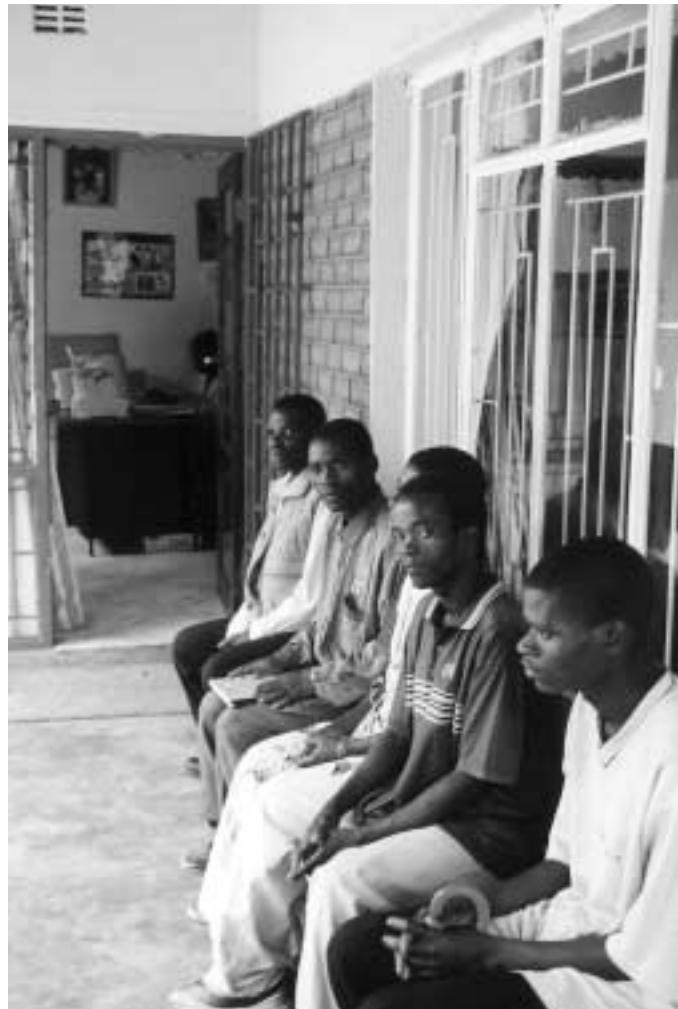
In de rij voor gratis juridische hulp bij NiZA-partner CARER (Blantyre, Malawi).

PEPSA is in 2004 gestart en zal in 2005 van zich laten horen in publicaties, seminars, maar vooral door concrete activiteiten in de vijf landen waar PEPSA actief is: Angola, de Democratische Republiek Congo, Mozambique, Swaziland en Zimbabwe.