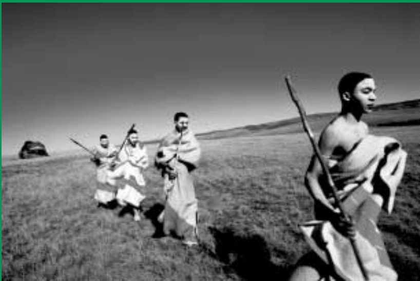
(UIT FOTOTENTOONSTELLING 'MOVING IN TIME')