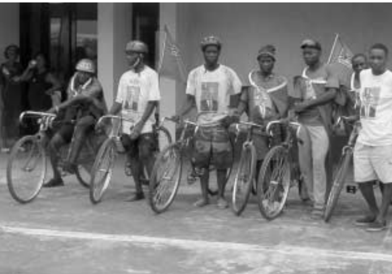
Plaatselijke wielrenclub voert campagne voor FRELIMO. (Nampula, Mozambique).