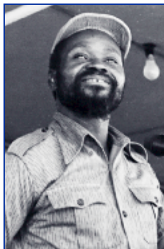
Samora Machel, de eerste president van de volksrepubliek Mozambique van 1975 - 1986.

Burgemeester Ed van Thijn roept in oktober 1987 de Amsterdamse bevolking op om de Beira-campagne te steunen. "De gemeente subsidieert deze campagne. Deze kan echter alleen echt succes hebben als de Amsterdamse bevolking en Amsterdamse instellingen hun steentje bijdragen. Ik doe hierbij een beroep op U om deze Beira campagne te steunen.