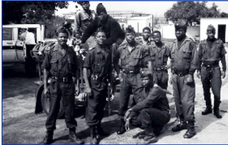
Trots poseert de havenbrandweer voor een zojuist uit Amsterdam ontvangen pomp aanhanger.

slachtoffer in de hoek van de container liggen. Ik weeg bijna 100 kilo, dus ze hebben een zware klus om mij daar uit te halen. Het is zinderend heet in zo'n container. Als je rechtop staat verbranden je oren. De vloer is de enige manier om veilig weg te komen. Daar is de zuurstof, bij de plinten en deuren. De rook en hitte gaan naar boven maar bij de vloer kun je nog wat zien. Op een gegeven moment raken ze in paniek. Het wordt te heet en ze rennen naar buiten om meer hulp te halen, want ik lig daar nog steeds. Dan komen ze terug met z'n drieën, dus wordt het nog heter en moeilijker. Deze oefening herhalen we net zolang tot de grootste angst eraf is. Dan wijzen we een nieuw slachtoffer aan en ervaren ze aan den lijve dat je het op de grond liggend langer vol kunt houden dan wanneer je daar rechtop staat en zoekt. We lieten ze ook al gauw zelf lessen geven. Dat werkt naar twee kanten: zij moeten het geleerde zelf steeds opnieuw herhalen én ze verwerven aanzien bij hun mensen en krijgen zo meer gedaan."