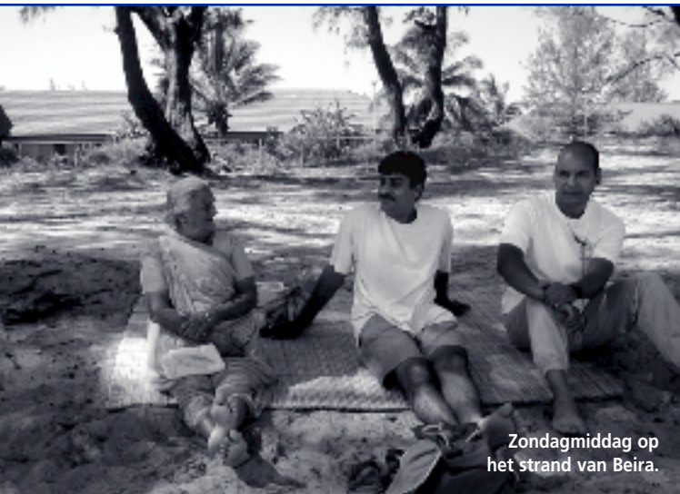
Zondagmiddag op het strand van Beira.

De expositie maakt een rondreis langs bibliotheken, kerken en buurthuizen in Amsterdam Oud-Zuid. Later volgen nog een manifestatie en een uitbreiding met foto's van het Sarphatipark. Dominee Eddie Reefhuis is een van de enthousiaste organisatoren van het parkenproject en bedenker van de prachtige titel: Aardse Paradijzen . Hij vertelt: