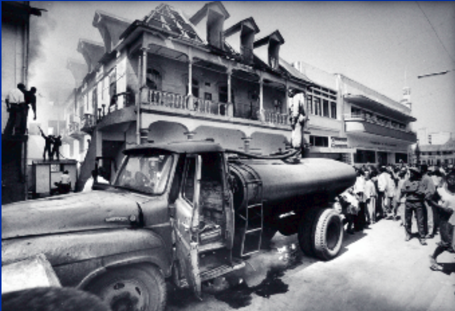
WUBBO DE JONG

Met bijzondere dank aan Wubbo de Jong († 2002), die in 1998 tijdens zijn bezoek aan Beira de brandweermannen van Beira fotografeerde in actie tijdens een grote brand in het centrum van de stad. De stadsbrandweer moest het doen met de op dat moment enige beschikbare, bijna antieke brandweerauto en zeer verouderd materiaal. Inmiddels beschikt de stadsbrandweer over 5 prima brandweerwagens en modern materiaal.