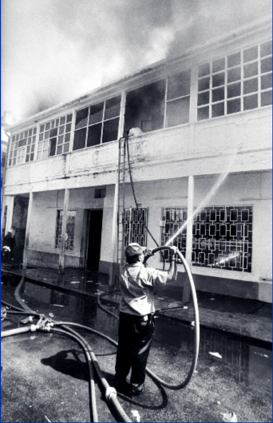
WUBBO DE JONG