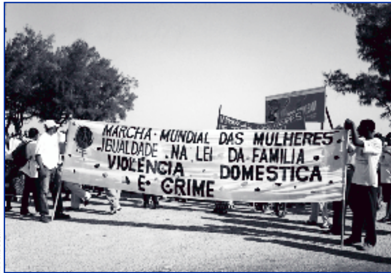
Vrouwen van vrouwenorganisatie Muleide demonstreren tijdens de internationale vrouwendag voor gelijkheid van rechten voor vrouwen en tegen huiselijk geweld.