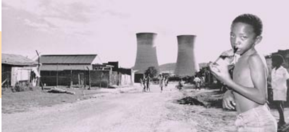
Zware industrie in Merebank, township bij Durban, Zuid-Afrika.