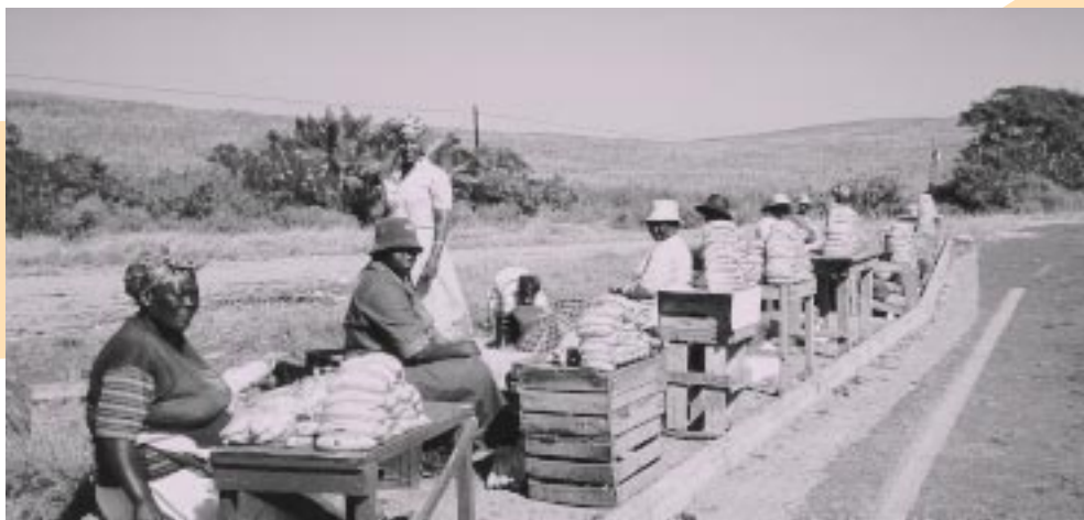
Vrouwen spelen een belangrijke rol in de economie van zuidelijk Afrika. Toch spelen ze een kleine rol in de besluitvorming over economische plannen zoals NePAD.

Deze drie voorbeelden laten de scheve verhoudingen binnen zuidelijk Afrika, en in de wereld, duidelijk zien. Om de armoede en ongelijke verdeling te verminderen, is een duurzame economische ontwikkeling noodzakelijk. Dit is alleen mogelijk als de economische macht in de wereld eerlijker wordt verdeeld. Nu bepalen enkele rijke landen de spelregels van de wereldeconomie. De mensen in zuidelijk Afrika moeten meer te zeggen krijgen over het economische beleid van hun eigen land en regio. Meer vrijheid en democratie om te werken aan hun eigen toekomst is daarom cruciaal. Vele organisaties in zuidelijk Afrika vechten hiervoor. Het Economieprogramma van NiZA steunt hen.