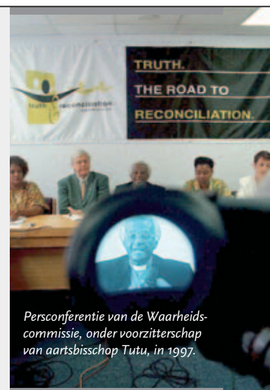
Persconferentie van de Waarheidscommissie, onder voorzitterschap van aartsbisschop Tutu, in 1997.

Dankzij deze unieke aanpak kon het gewelddadige verleden op een genuanceerde en veelomvattende wijze vastgelegd worden, met plaats voor zowel een structurele analyse als de beleving van degenen die het hebben meegemaakt. Mensen werden gestimuleerd met hun verhaal