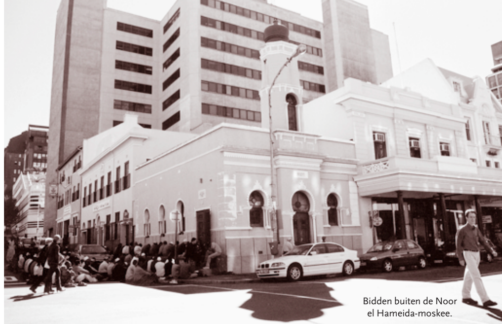
Bidden buiten de Noor el Hameida-moskee.

Een dieptepunt in de geschiedenis van de Langstraat leken de jaren tachtig, toen de voortdurende burgeroorlog in het land zijn toppunt be-