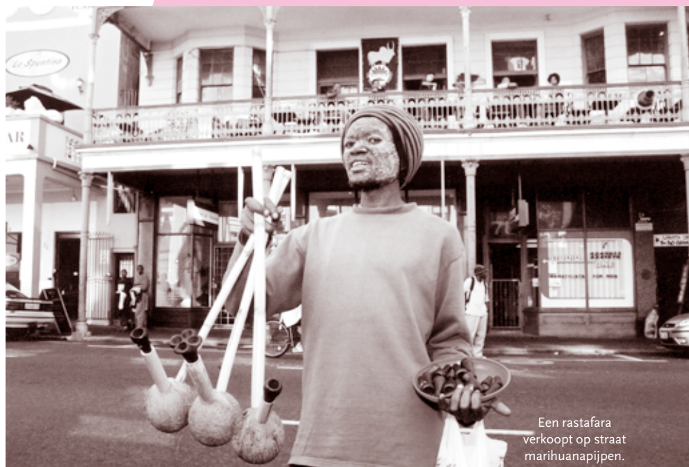
Een rastafara verkoopt op straat marihuanapijpen.

reikte en het hele leven doortrokken raakte van vertwijfeling. De straat raakte steeds meer bevolkt door een troep regelrechte zonderlingen, levend in de marge van de maatschappij: zwervers, verwilderde straatkinderen, een keur aan bedelaars en natuurlijk prostituees. Maar de Langstraat heeft te midden van dit alles nooit haar hart of haar grillige charme verloren.