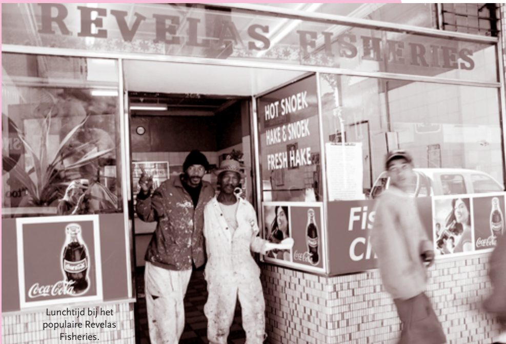
Lunchtijd bij het populaire Revelas Fisheries.

En terwijl degenen die bang waren voor de politieke en maatschappelijke veranderingen het stadshart ontvluchtten, kwam er een forse instroom op gang van nieuwe bewoners, grotendeels afkomstig uit West-Afrika. Zij vulden de leeggekomen ruimte op met nieuwe geluiden, geuren en gewoontes.