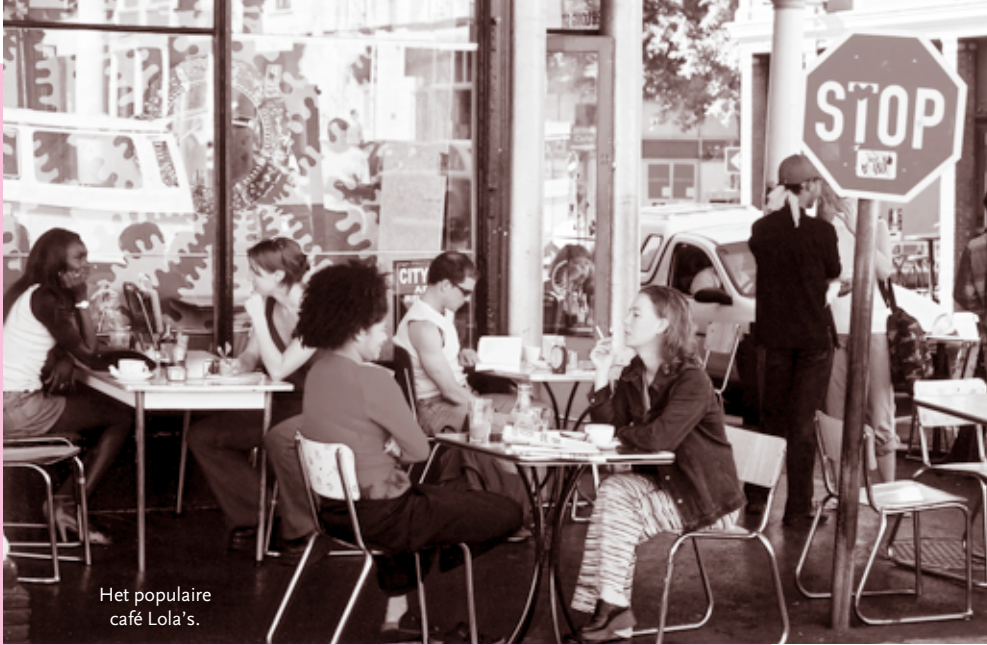
Het populaire café Lola's.